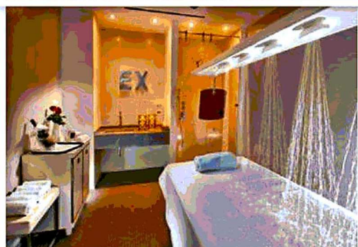
La camera Deluxe