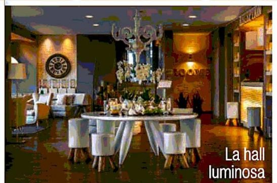
La hall luminosa