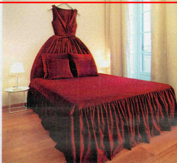
Sopra, una stanza della Maison Moschino a Milano. A sinistra, il Grand Hotel Parco dei Principi di Sorrento ideato da Gio Ponti : conserva ancora pavimenti e arredi originali

resce l'importanza dell'arredamento quando si deve scegliere un albergo. Ma che cosa significa «hotel di design»? Silvia Salvaderi comincia il suo L'hotel che piace ai clienti (Franco Angeli, pp. 110, euro 15), proprio con il capitolo Il design che incanta . E scrive: «La prima regola per chi progetta un hotel o ne rinnova l'interior è definire un design che avvicini l'ospite, non che lo respinga. Sembra un'indicazione banale eppure troppe volte i progettisti si sono lasciati prendere la mano, dando vita ad ambienti appariscenti ma poco funzionali».